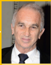
Alain Terzian, Πρόεδρος

Στόχος του Πανόραματος Χρυσές Νύχτες, είναι να προσεγγίσουμε τη διεθνή κινηματογραφική αριστεία, μέσα από τις καλύτερες μικρού μήκους ταινίες της χρονιάς.