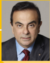
Carlos Ghosn, Γενικός Διευθυντής

Για 8η συνεχής χρονιά, η συνεργασία μεταξύ της Ακαδημίας César και της Renault, εμπλουτίζει το διεθνές κινηματογραφικό τοπίο, με μια εκδήλωση αφιερωμένη στις ταινίες μικρού μήκους: