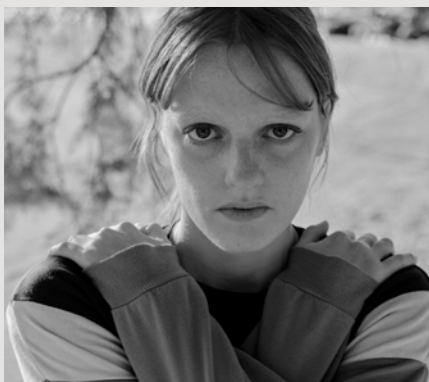
ΦΛΟΜΑΡΙΑ ΠΑΠΑΔΑΚΗ ΒΡΑΒΕΙΟ ΙΡΙΣ Β' ΓΥΝΑΙΚΕΙΟΥ ΡΟΛΟΥ

Γεννήθηκε στην Αθήνα. Είναι απόφοιτος της Κρατικής Σχολής Ορχηστρικής Τέχνης (ΚΣΟΤ) και της Δραματικής Σχολής του Εθνικού Θεάτρου. Έχει συνεργαστεί με τους: Θ. Μοσχόπουλο, Κ. Ευαγγελάτου, Σ. Λιβαθινό, Α. Καραζήση, Ε. Λυγίζο, Ν. Χατζόπουλο, Δ. Αγαρτζίδα, Ε. Θεοδώρου, Μ. Μαγκανάρη, Α. Χιώτη, Γ. Κουτλή, Δ. Καραντζά, την ομάδα Blitz κ.α. Έχει δουλέψει για το Εθνικό Θέατρο και το Φεστιβάλ Αθηνών & Επιδαύρου. Το 2020 τιμήθηκε με το Βραβείο Μελίνα Μερκούρη για την ερμηνεία της στην παράσταση «Η τραγική ιστορία του Άμλετ, ενός πρίγκηπα της Δανίας» σε σκηνοθεσία Έκτορα Λυγίζου. Στον κινηματογράφο έχει τιμηθεί με το Βραβείο Γυναικείας Ερμηνείας στο Διεθνές Φεστιβάλ Κινηματογράφου Θεσσαλονίκης για τις ταινίες "Park" (2016) και "Animal" (2023) της Σοφίας Εξάρχου. Για την ταινία "Animal" έλαβε επίσης το Βραβείο Καλύτερης Γυναικείας Ερμηνείας στο Διεθνές Φεστιβάλ Κινηματογράφου του Λοκάρνο (2023) και το Βραβείο Α' Γυναικείου ρόλου στα Βραβεία Ίρις (2024).