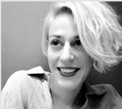
ΔΗΜΗΤΡΑ ΒΛΑΓΚΟΠΟΥΛΟΥ ΒΡΑΒΕΙΟ ΙΡΙΣ Α' ΓΥΝΑΙΚΕΙΟΥ ΡΟΛΟΥ

Γεννήθηκε στην Αθήνα. Είναι απόφοιτος της Κρατικής Σχολής Ορχηστρικής Τέχνης (ΚΣΟΤ) και της Δραματικής Σχολής του Εθνικού Θεάτρου. Έχει συνεργαστεί με τους: Θ. Μοσχόπουλο, Κ. Ευαγγελάτου, Σ. Λιβαθινό, Α. Καραζήση, Ε. Λυγίζο, Ν. Χατζόπουλο, Δ. Αγαρτζίδα, Ε. Θεοδώρου, Μ. Μαγκανάρη, Α. Χιώτη, Γ. Κουτλή, Δ. Καραντζά, την ομάδα Blitz κ.α. Έχει δουλέψει για το Εθνικό Θέατρο και το Φεστιβάλ Αθηνών & Επιδαύρου. Το 2020 τιμήθηκε με το Βραβείο Μελίνα Μερκούρη για την ερμηνεία της στην παράσταση «Η τραγική ιστορία του Άμλετ, ενός πρίγκηπα της Δανίας» σε σκηνοθεσία Έκτορα Λυγίζου. Στον κινηματογράφο έχει τιμηθεί με το Βραβείο Γυναικείας Ερμηνείας στο Διεθνές Φεστιβάλ Κινηματογράφου Θεσσαλονίκης για τις ταινίες "Park" (2016) και "Animal" (2023) της Σοφίας Εξάρχου. Για την ταινία "Animal" έλαβε επίσης το Βραβείο Καλύτερης Γυναικείας Ερμηνείας στο Διεθνές Φεστιβάλ Κινηματογράφου του Λοκάρνο (2023) και το Βραβείο Α' Γυναικείου ρόλου στα Βραβεία Ίρις (2024).